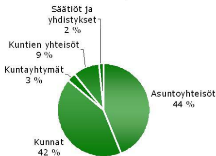
Antolainakanta lainantajittain 30.6.2003

Luotonantajien kiinnostus kuntasektorin asiakkaisiin on säilynyt vahvana, mikä on pitänyt lainamarginaalit alhaisina. Kilpailutilanne tulee säilymään samanlaisena loppuvuoden.