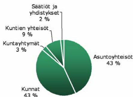
Antolainakanta lainantottajittain 31.3.2004

Lainojen kysyntä on ollut selvästi vilkkaampaa kuin edellisen vuoden vastaavana ajankohtana. Vuoden 2004 pitkäaikaisen antolainauksen arvioidaan nousevan noin 800 miljoonaan euroon (2003: 691 miljoonaa euroa).