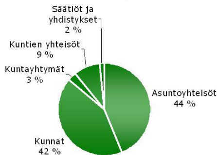
Antolainakanta lainanottajittain 30.6.2003

Luotonantajien kiinnostus kuntasektorin asiakkaisiin on säilynyt vahvana, mikä on pitänyt lainamarginaalit alhaisina. Kilpailutilanne tulee säilymään samanlaisena loppuvuoden.