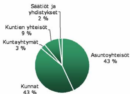
Antolainakanta lainantottajittain 31.3.2004

Lainojen kysyntä on ollut selvästi vilkkaampaa kuin edellisen vuoden vastaavana ajankohtana. Vuoden 2004 pitkäaikaisen antolainauksen arvioidaan nousevan noin 800 miljoonaa euroon (2003: 691 miljoonaa euroa).