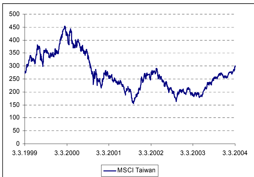
Kuva: MSCI Taiwan –indeksin historiallinen kehitys viimeisen viiden vuoden ajalta (historiallinen kehitys ei ole tae tulevasta)