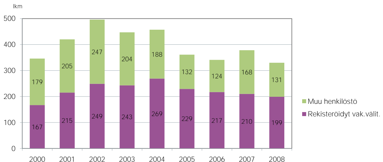
Kuvio 2. Vakuutusmeklariyritysten henkilöstö 2000–2008