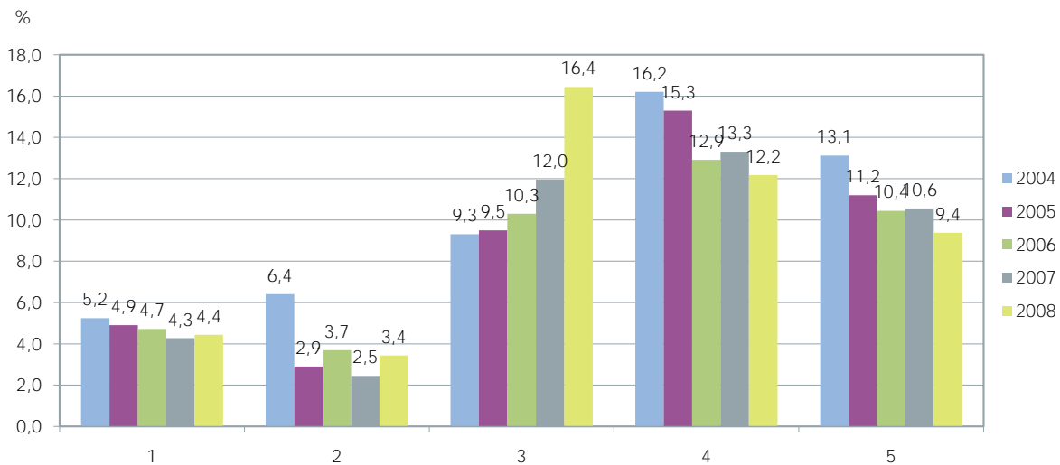
Kuvio 1. Välitettyjen vakuutusten osuus Suomen vakuutusmaksutulosta 2004–2008